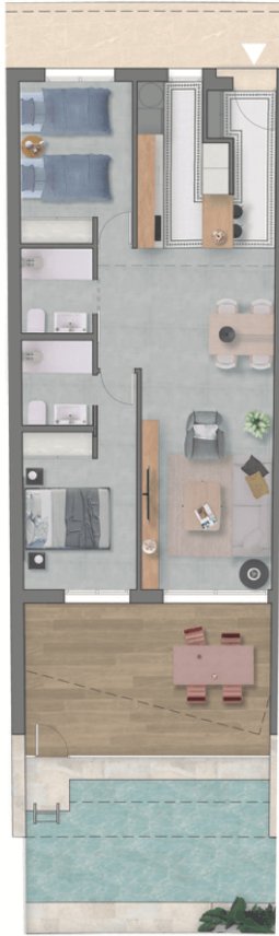
Planta baja / Ground Floor