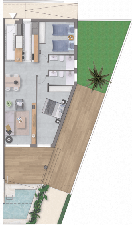
Planta baja / Ground Floor