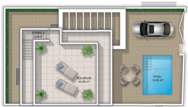
PLOT SURFACE 185,86 m²