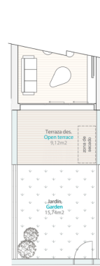
Terraza-Jardin P.B. | Terrace-Garden G.F.