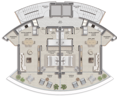
Planta Tipo A (3 Dormitorios)

Superficie Construida: 96,00m 2 | Superficie Útil: 38,00m 2 Terrazas: 2,75m 2 | Terraza Cubierta: 14,35m 2