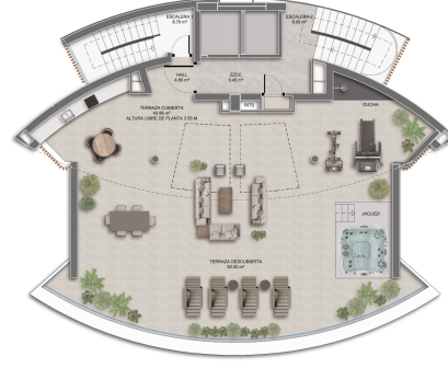
Planta de Cubierta Planta 16

Superficie Interior: 8,00m 2 | Terraza Cubierta: 43,89m 2 Terraza Descubierta: 42,00m 2