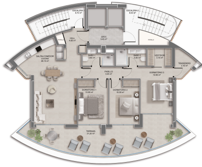
Planta Tipo C (3 Dormitorios)

Superficie Construida: 104,85m 2 | Superficie Útil: 88,87m 2 Terrazas: 3,19m 2 | Terraza Cubierta: 27,20m 2