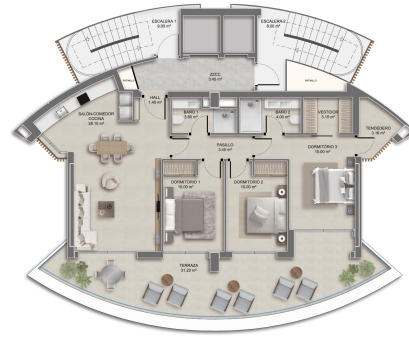
Planta Tipo B (3 Dormitorios)

Superficie Construida: 90,85m 2 | Superficie Útil: 78,72m 2 Terrazas: 3,19m 2 | Terraza Cubierta: 31,20m 2