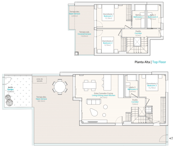
Planta Alta | Top Floor