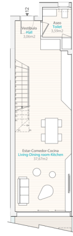
Planta Baja | Ground Floor