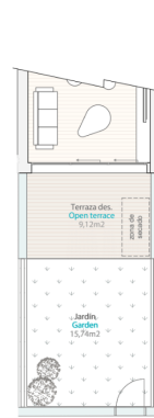
Terraza-Jardin P.B. | Terrace-Garden G.F.