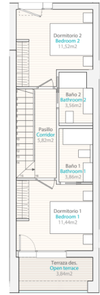
Planta Alta | Top Floor