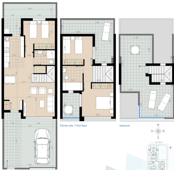
Planta baja / Ground floor