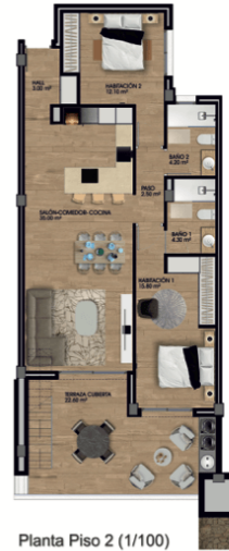
Planta Piso 2 (1/100)