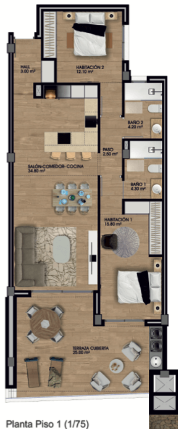
Planta Piso 1 (1/75)