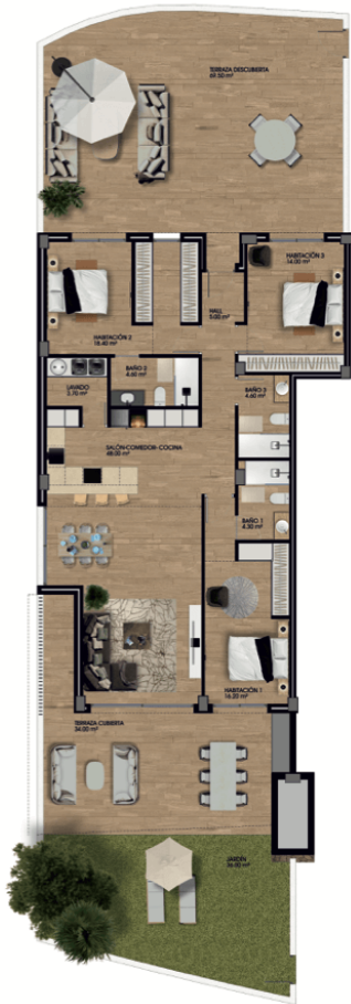
Planta Baja (1/100)