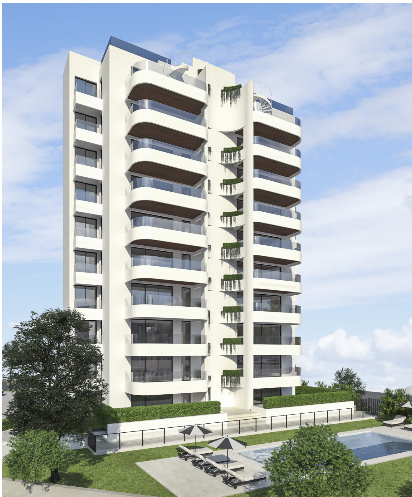
Гуардамар дель Сегура Квартира в Гуардамарі Номер пропозиції: 18177