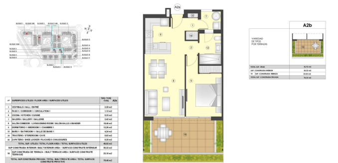
TIPO/TYP/TYPE A2a October/October/Octobre 2024 Apartament: 1 Dormitori + 1 Bany - Plats Segats Apartment: 1 Bedroom + 1 Bathroom - Segats floor Appartement: 1 Chambre + 1 Salle de bain - Devèzeville étage