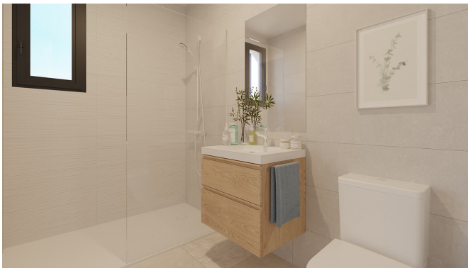
PORTAL 2 / PLANTA QUINTA PUERTA B