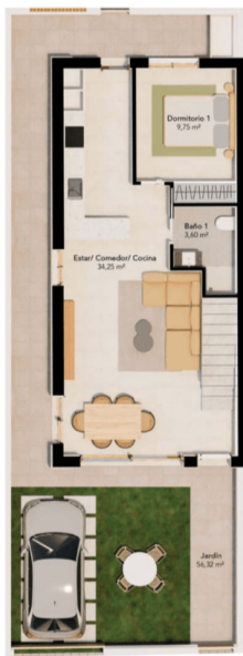
PLANTA BAJA GROUND FLOOR