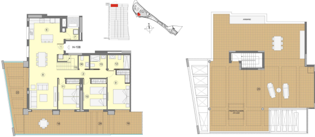
TIPO / TYPE / ТИП H-108

Área: 3 Dormitorios + 3 Baños - Planta 24 + Solarium Área: 3 Bedrooms + 3 Bathrooms - Floor 24 + Solarium Площадь: 3 спальни + 3 ванных комнаты - этаж 24 + Солнцезащитный козырек