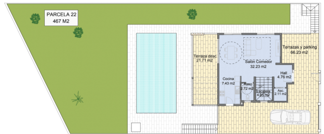
SUPERFICIE CONSTRUIDA PLANTA ACCESO: 62,10 m2 SUPERFICIE CONSTRUIDA DE TERRAZAS Y PARKING: 87,94 m2