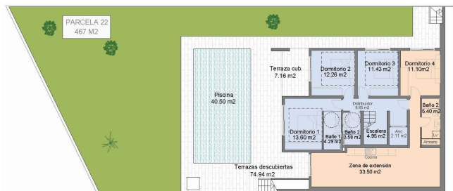
SUPERFICIE CONSTRUIDA PLANTA BAJA: 123,52 m2