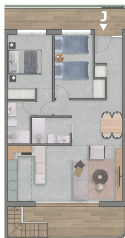
Planta primera / First Floor