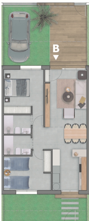
Planta baja / Ground Floor