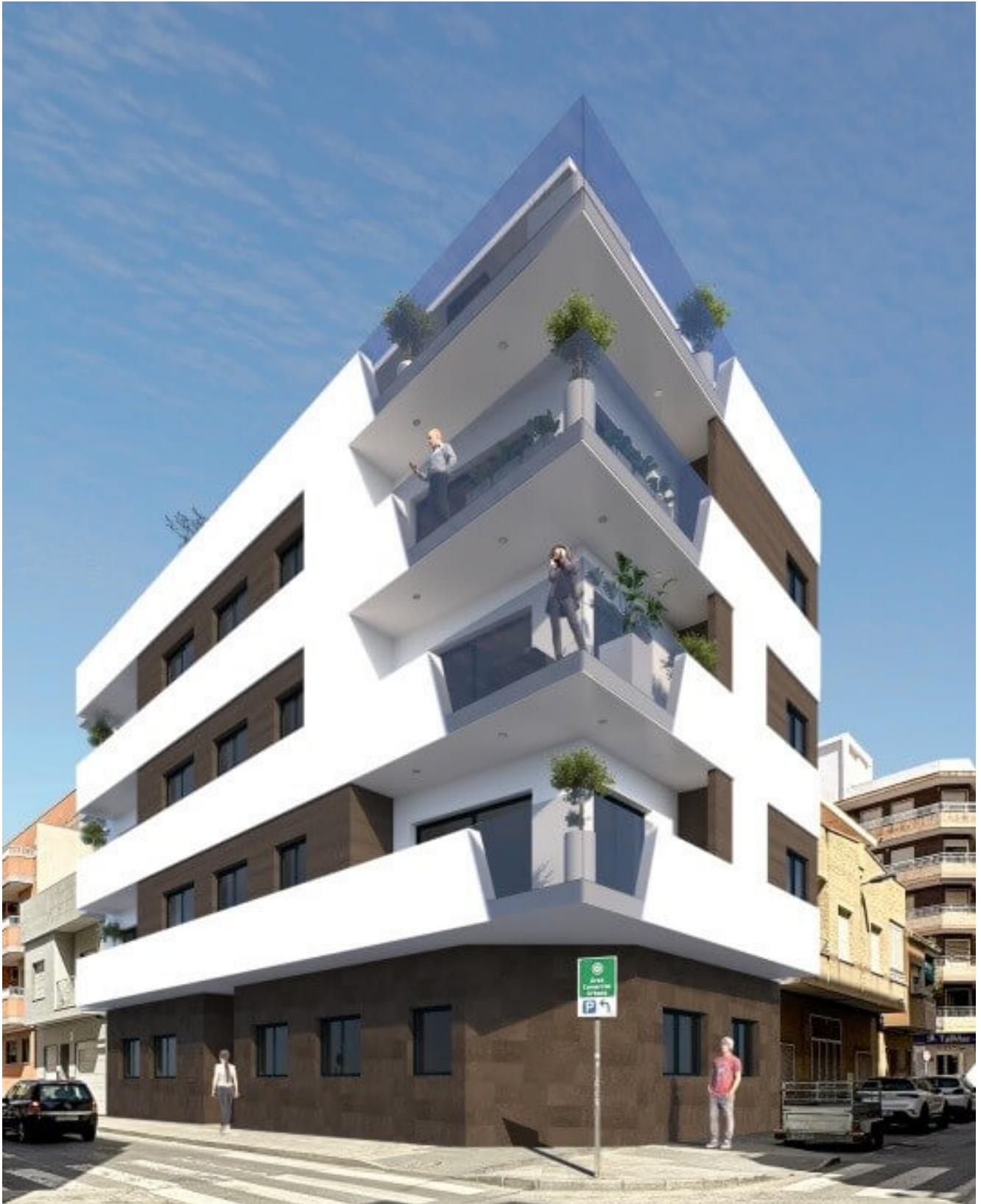
Torrevieja Wohnung in Torrevieja