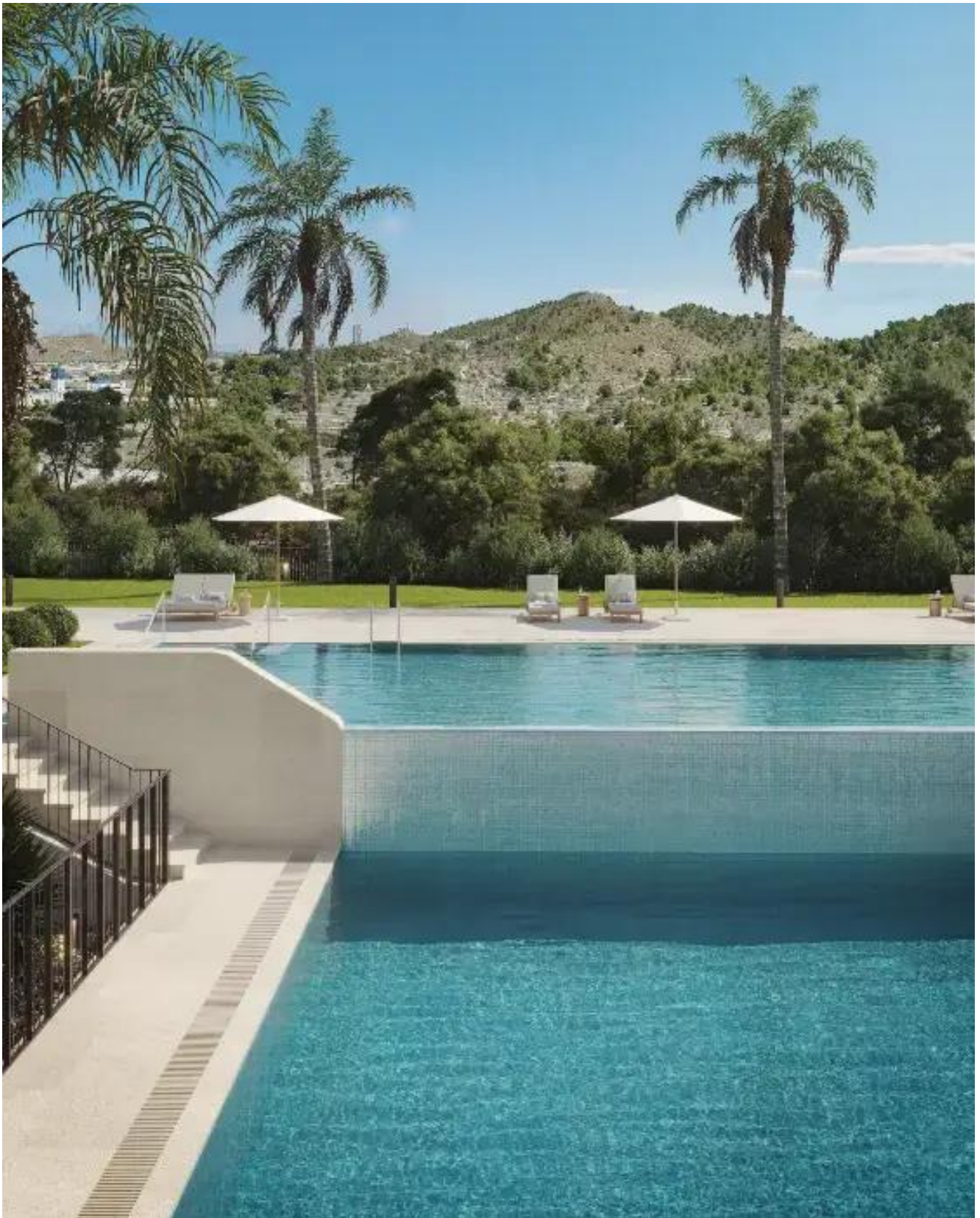
Villajoyosa Wohnung in Villajoyosa