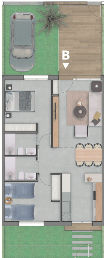
Planta baja / Ground Floor