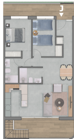
Planta primera / First Floor