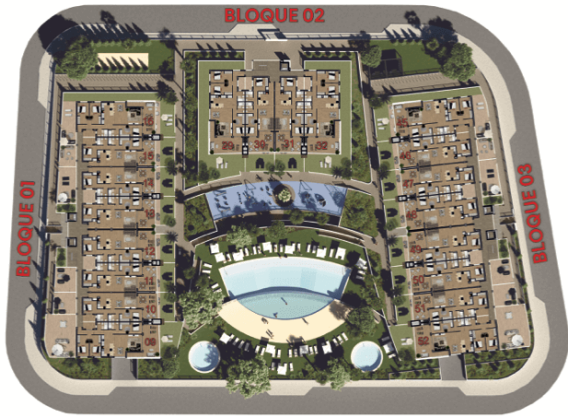
Planta Piso 1