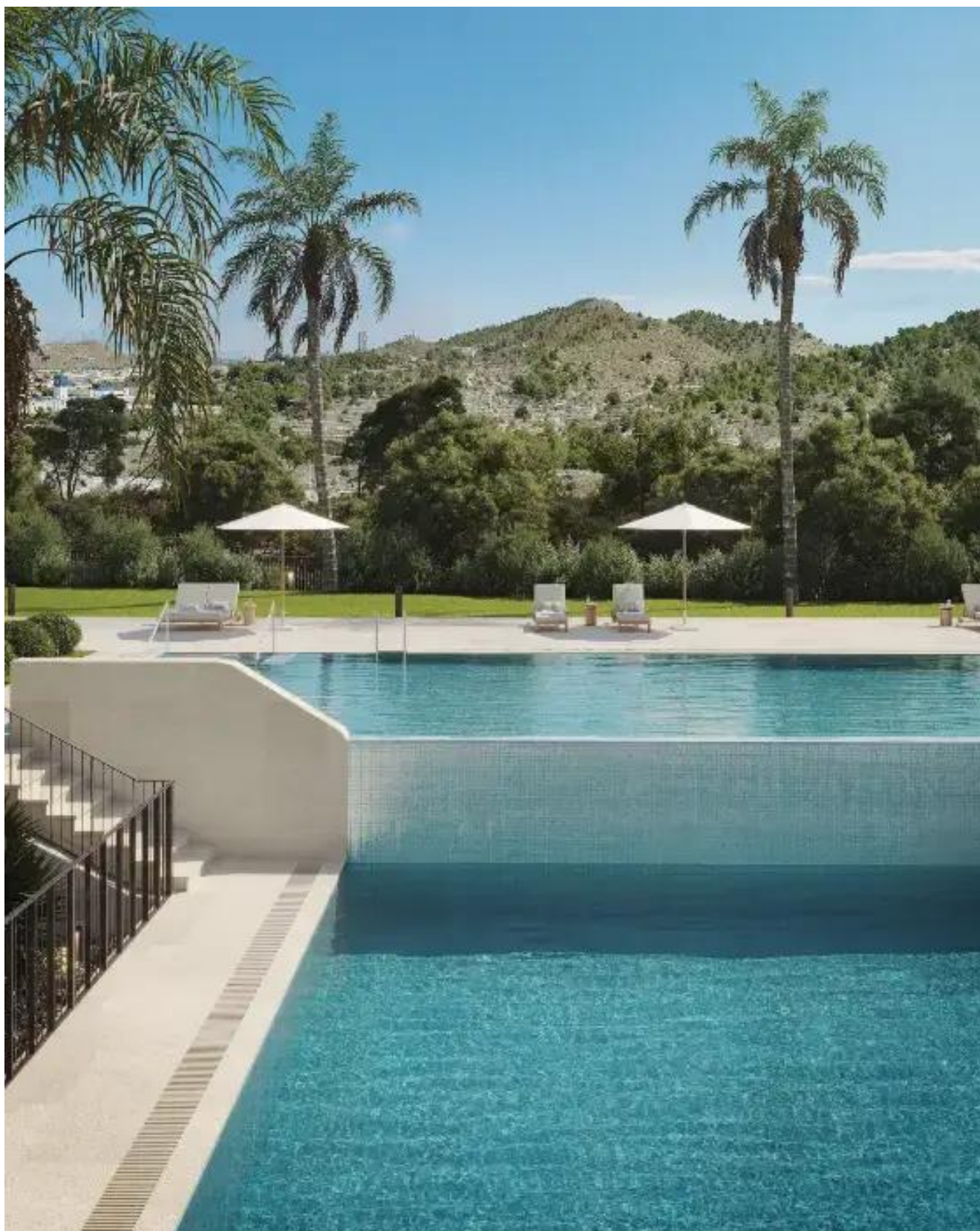
Villajoyosa Appartement dans Villajoyosa