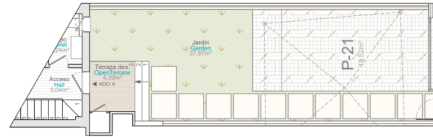
Planta baja | Ground Floor