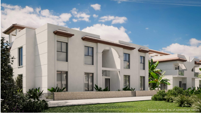
Artistic image free of contractual nature.