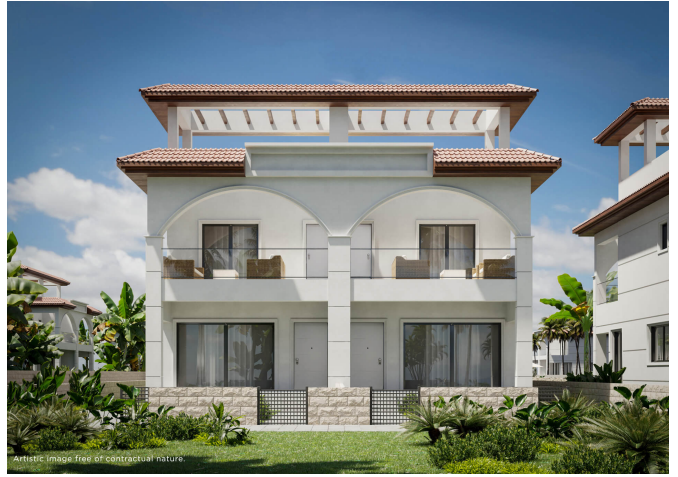
Artistic image free of contractual nature.