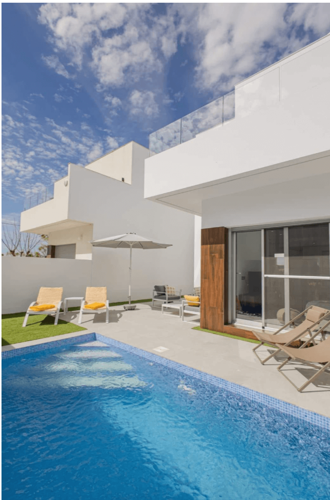
San Fulgencio Villa med privat basseng